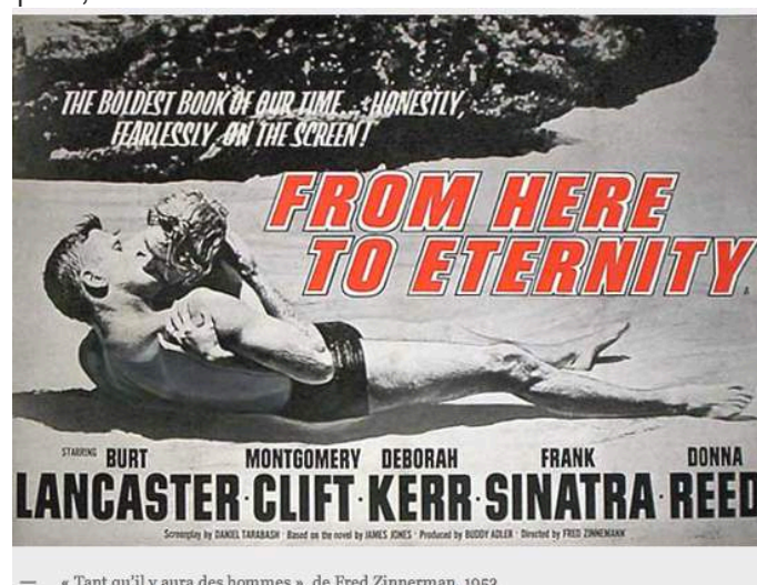
• — « Tant qu'il y aura des hommes », de Fred Zinnerman, 1953